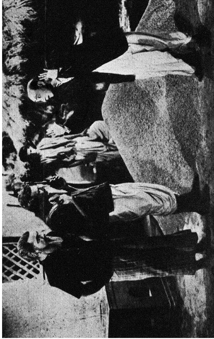
धरतीके लाल : कलकत्तेका अनाजचोर काले बाजारके लिये भोलेभाले किसानोंसे मोल-भाव कर रहा है । [ देखिये पृष्ठ ९४ ]